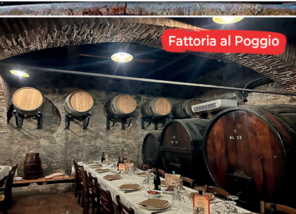
Fattoria al Poggio