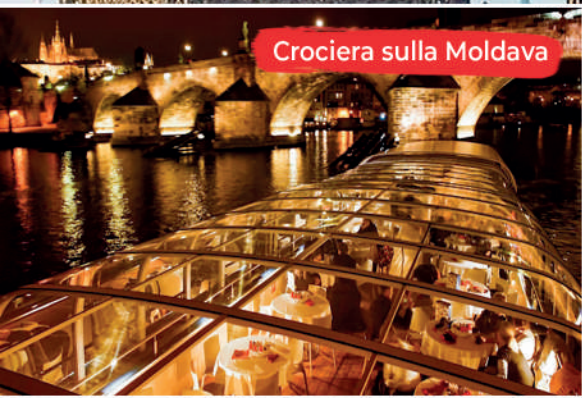
Crociera sulla Moldava